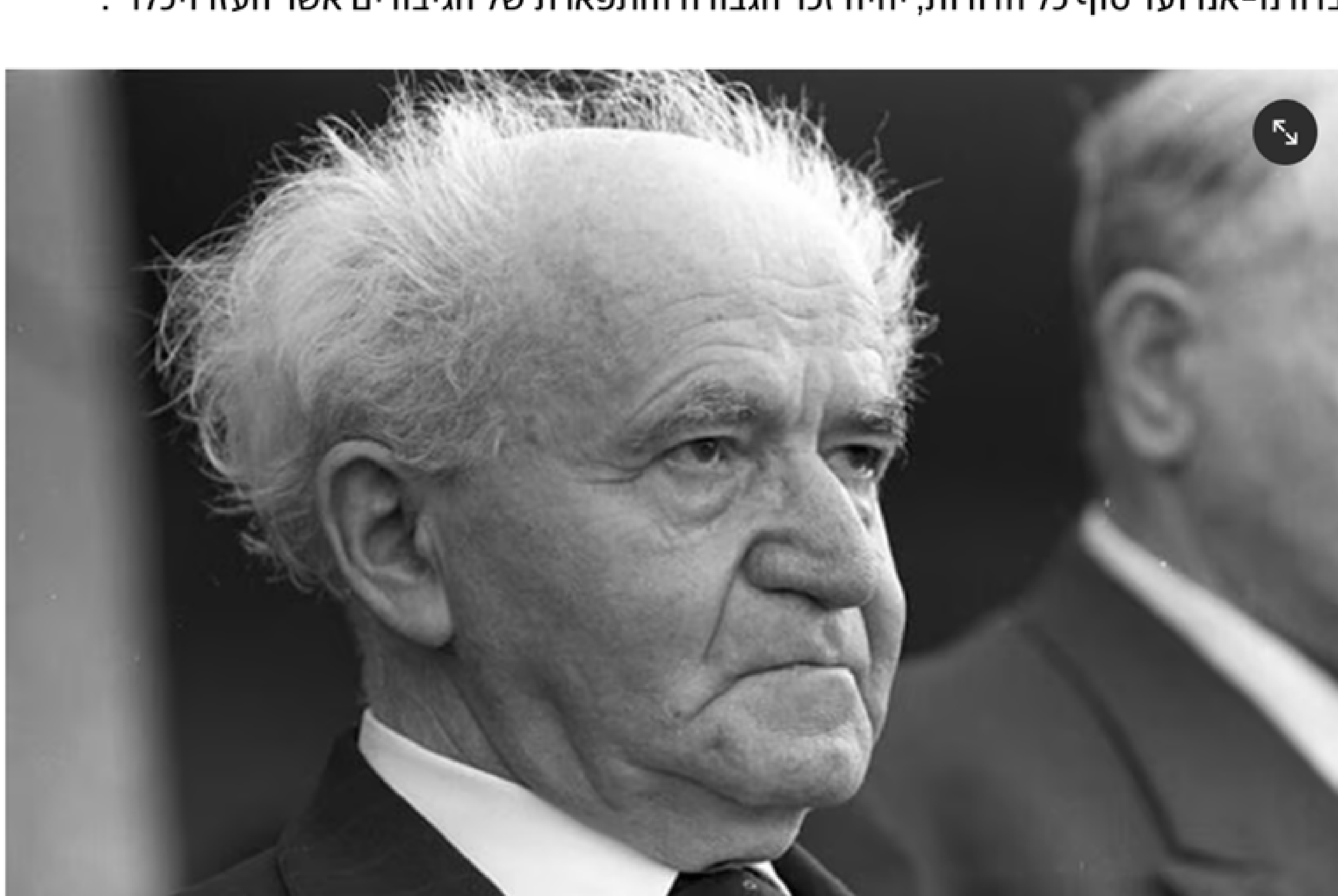
דוד בן גוריון. השווה בין הנטיעות של העצים למאבק על הארץ

"בהגדה שלי אני מביא חלק מהנאום שלו, שמופיע בספרו 'חזון ודרך': 'אנו נוטעים יער ועוד יער, ועוד ניטע הרבה יערות, לקיים משאלתם ורצונם של הלוחמים אשר מסרו את נפשם על שחרור מולדתם, הפרחתה ובניינה למען יוכלו עם ישראל כולו, על כל גלויותיו, לשוב לארצו קוממיות ולחיות בה חיי חרות ורווחה. אך לא ביער עצים אשר ניטע ולא במצבת אבנים אשר נבנה ייחקה ויישמר זכר הגיבורים אשר נפלו על גאולת עמם ומולדתם. בלב העם היהודי, בלב כל בני ישראל, בדורנו-אנו ועד סוף כל הדורות, יהיה זכר הגבורה והתפארת של הגיבורים אשר העזו ויכלו".