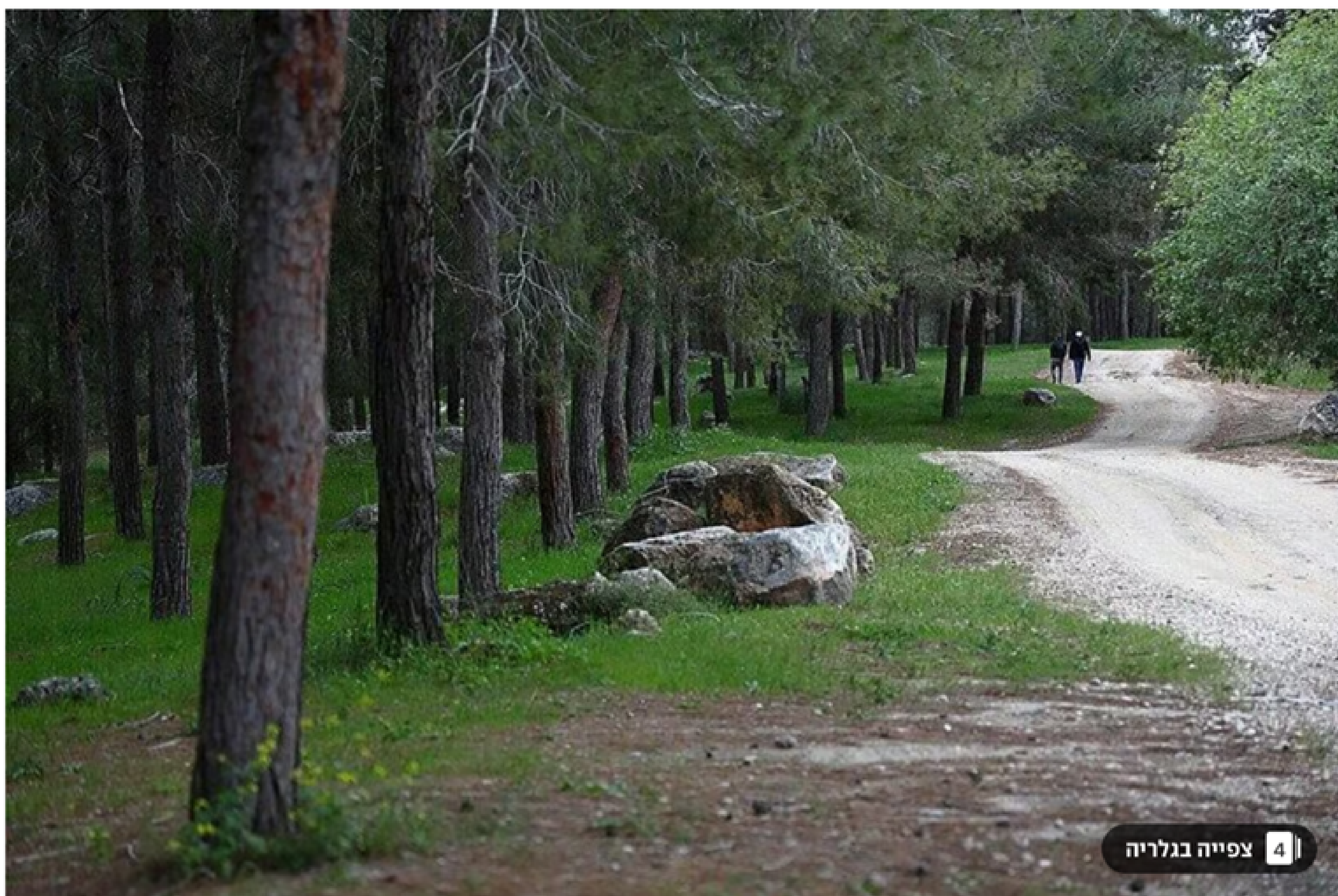
יער קק"ל. הנטיעות הפכו לאקט של זיכרון וגבורה

"ב-15 השנים האחרונות אני עורך סדרים לט"ו בשבט בארץ ובחו"ל", אומר דהאן, "גיליתי שאנשים לא יודעים איך החג התגבש וכל אחד יוצר פרשנות משלו. היעדר הבנת המהות של ט"ו בשבט בציבוריות הישראלית, היא שהביאה אותי לכתוב את ההגדה".